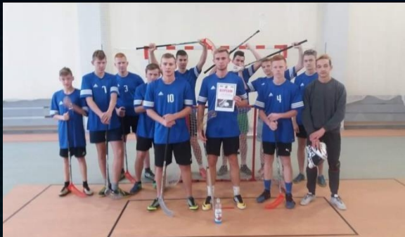
Powiatowy Zespół Szkół Nr 3 w Kościerzynie Przed nami FINAŁ WOJEWÓDZKI!